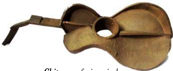
Chitarra - fusione in bronzo, 45 cm di lunghezza