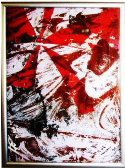
Ciclo Solare - Tecnica mista su vetro 25x35 cm