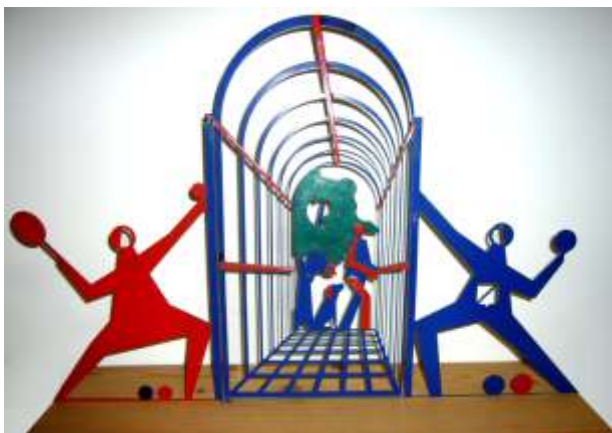
Modellino cancello - ferro smaltato altezza 25 cm