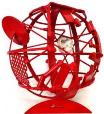
Incandescenza centrale - ferro saldato, smaltato rosso, con frammento di quarzo incastonato diametro 33 cm