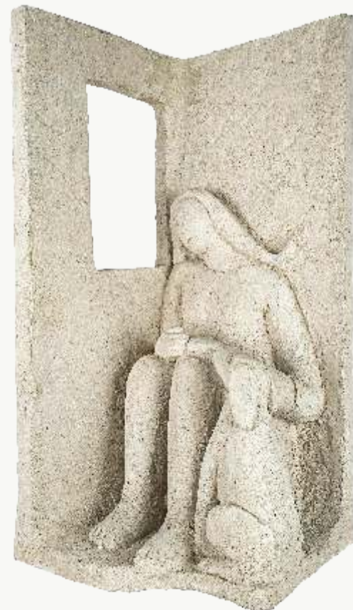
Donna con cane - 1991

da "Silenti creature", 2008 Clizia Orlando