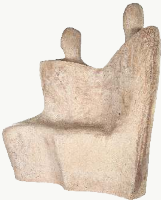
Due Teste - 1998